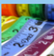
Tabela de medidas Brasil x EUA – Infantil 22 Comentários

Qual mala INTERNACIONAL comprar? 5 Dicas para fazer a melhor escolha 19 Comentários